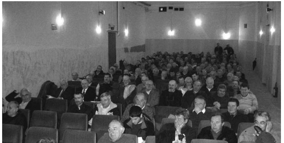
Uno scorcio dell'Assemblea

L'ottima iniziativa di realizzare un libro sull'argomento ha visto la sua conclusione con una importante manifestazione che si è svolta al Teatro Giacosa, anche a ricordo del 90° anniversario della fine della Grande Guerra.