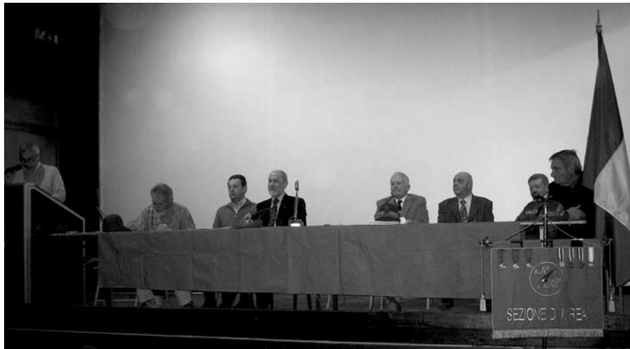
Il tavolo della Presidenza

propri Monumenti ai Caduti. Il nostro vessillo era presente anche alla manifestazione nazionale di Trento.